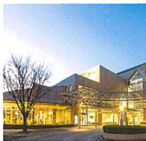
テルサレストラン